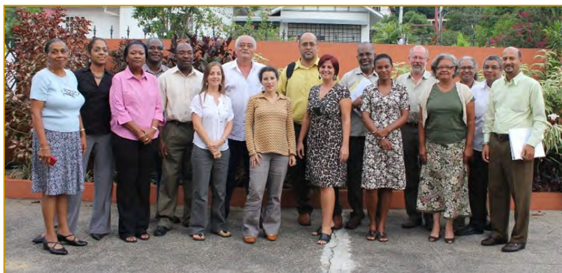
Los miembros del RACC y algunos del equipo de CANARI, de izquierda a derecha:

Los miembros del RACC son también competentes en los cuatro idiomas oficiales del Caribe (inglés, francés, creole y español). CANARI está muy orgulloso de tener los miembros del RACC como consejeros externos. Es el equipo ideal para asegurar equidad y transparencia.