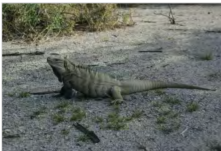
Vista de una iguana de Ricord in Cabritos, especie críticamente amenazada según la Lista Roja de la UICN.