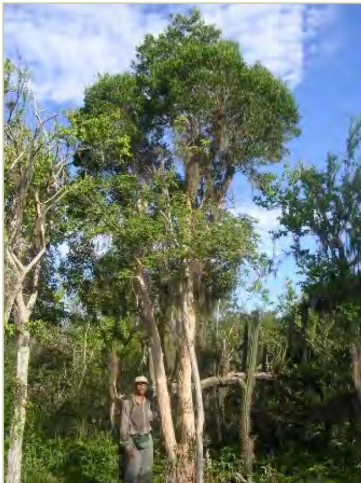
Canelilla en su estado natural. Este árbol endémico se ve amenazado por la recolección no sostenible de sus hojas.

Grupo Jaragua fue creado en 1987 para aumentar el apoyo de la sociedad civil en la implementación y co-manejo del Parque Nacional Jaragua. En 2002, el Parque Jaragua pasó a formar parte de la recién creada RBJBE. Esto motivó al Grupo a aumentar su rango de acción en sentido geográfico e incluir nuevas líneas de trabajo, especialmente la defensoría y políticas ambientales a nivel nacional e internacional.