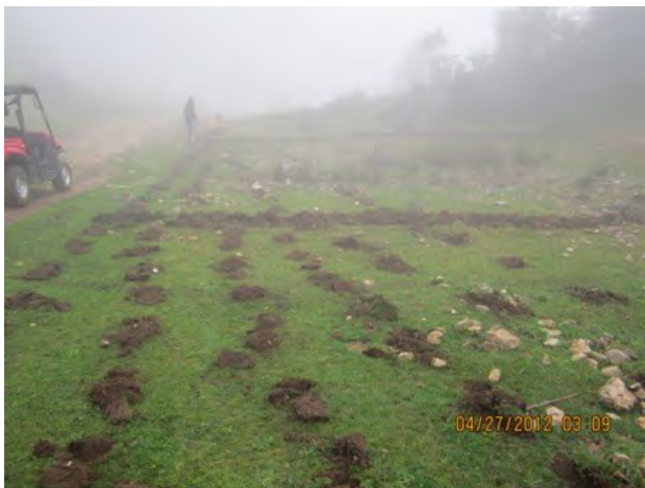
Reboisement d'une clairière en Pinus occidentalis , dans la réserve forestière de l'Unité II de la Forêt des Pins