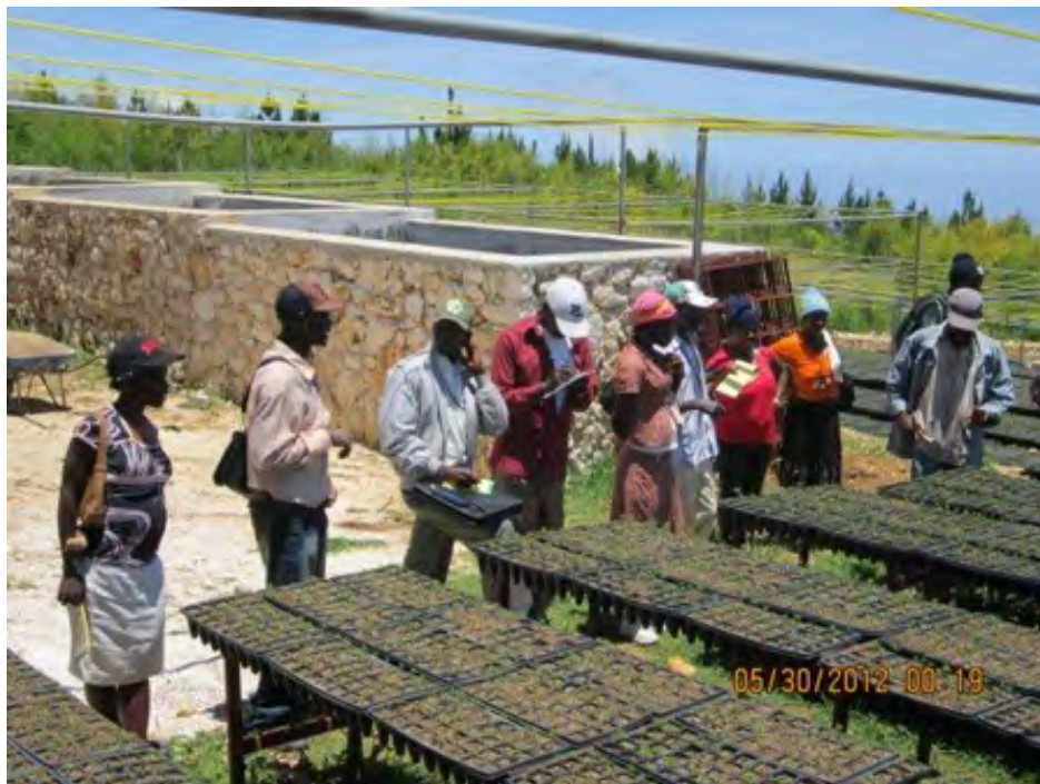
Reproduction des plantules d'essences végétales natives, dans une des pépinières de l'OPDFM, à l'Unité II de la Forêt des Pins

Le projet constitue un pas important vers l'objectif du Ministère de l'Environnement, qui projette d'établir à U2 FdP une Unité de Conservation, avec plus de 10.000 hectares de forêt.