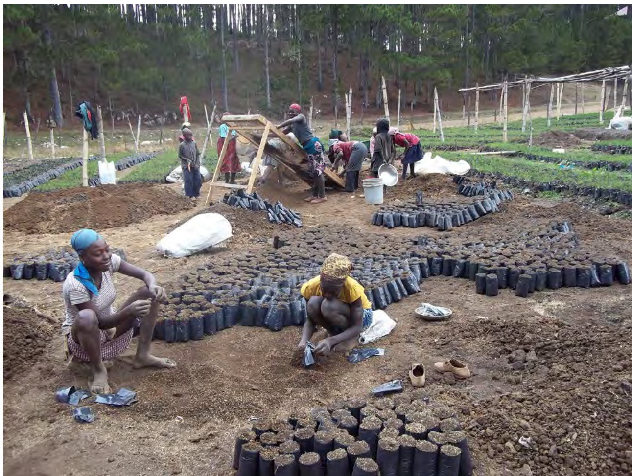
Préparation de substrat et remplissage de sachets dans une des pépinières de multiplication du Pinus occidentalis

U2 FdP fait partie du Massif de la Selle, déclaré Réserve de la Biosphère par l'UNESCO, et des zones prioritaires du Corridor 1 Biologique dans la Caraïbe. Cette Réserve était l'objet d'une destruction systématique qui a fait passer sa superficie de 15.300 à 6.600 hectares.