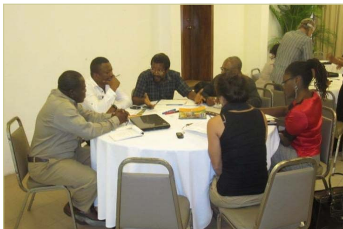
Participantes del taller de acuerdos de conservación en Haití

Cada taller incluyó discusiones sobre el uso de iniciativas basadas en incentivos para alcanzar la conservación y el desarrollo comunitario, y sobre la viabilidad de utilizar el modelo de acuerdos de conservación del CSP en los tres países. Los talleres también brindaron la oportunidad a las organizaciones para expresar su interés en evaluar, diseñar e implementar acuerdos de conservación con el apoyo del CSP. Ahora el equipo del CSP está trabajando con ONGs y organizaciones comunitarias de República Dominicana, Haití y Jamaica en el desarrollo de análisis de factibilidad más detallados y de planes de financiamiento para iniciativas potenciales. Estos productos proporcionarán una base para la futura implementación de proyectos de acuerdos de conservación.