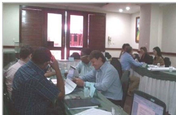
Participantes del taller de acuerdos de conservación en República Dominicana

Los participantes hicieron un ejercicio para determinar la factibilidad de implementar acuerdos de conservación en el Monumento Natural Padre Miguel Domingo Fuertes y el Parque Nacional Montaña La Humeadora en República Dominicana; Parque Nacional Massif de la Selle, Parque Nacional Massif de la Hotte y Patrimonio Comunitario Taíno de Bainet en Haití, y Hellshire Hills, Reserva Forestal Cockpit Country y Pedro Bank y Cays en Jamaica.