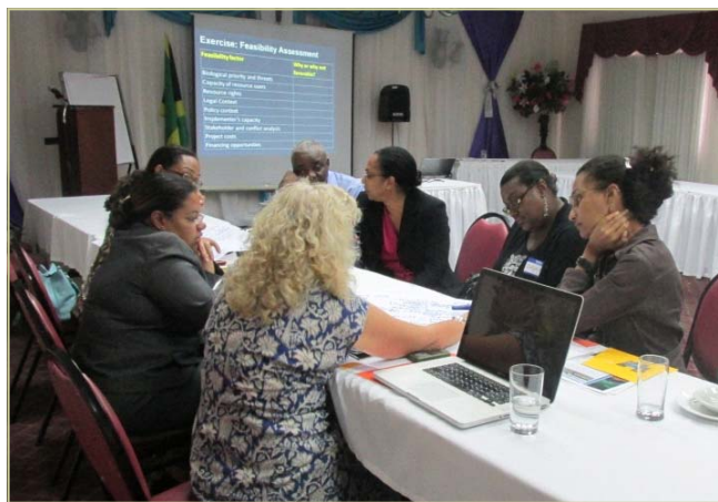
Participantes en el taller de acuerdos de conservación en Jamaica